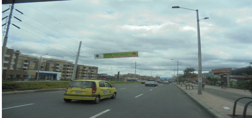
Fotografía No. 3. Elementos instalados en Espacio Público. Operativo en la Localidad de Usaquén, día 11 de Julio de 2015. Pasacalle ubicado en la Carrera 9 Calle 160.

ALCALDÍA MAYOR DE BOGOTÁ D.C. SECRETARÍA DE AMBIENTE