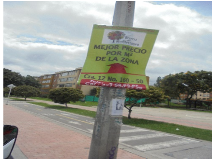
Fotografía No. 1. Elementos instalados en Espacio Público. Operativo en la Localidad de Usaquén, día 11 de Julio de 2015. Pendón ubicado en la Carrera 9 Calle 145.

ALCALDÍA MAYOR DE BOGOTÁ D.C. SECRETARÍA DE AMBIENTE