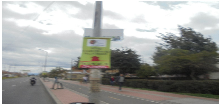
Fotografía No. 2. Elementos instalados en Espacio Público. Operativo en la Localidad de Usaquén, día 11 de Julio de 2015. Pendón ubicado en la Carrera 9 Calle 164.